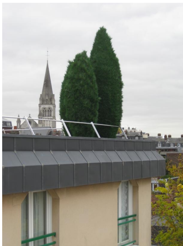
Arbustes en terrasse